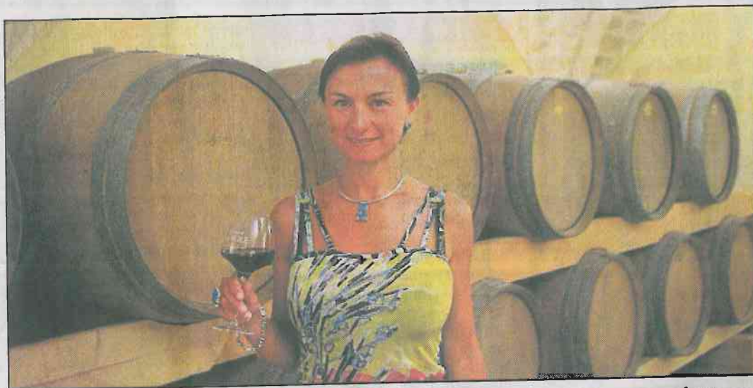
La Yole, c'est un domaine viticole ou une histoire d'amour née sur le littoral vendrois, entre terre et mer.