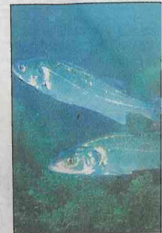
Un redoutable carnassier.